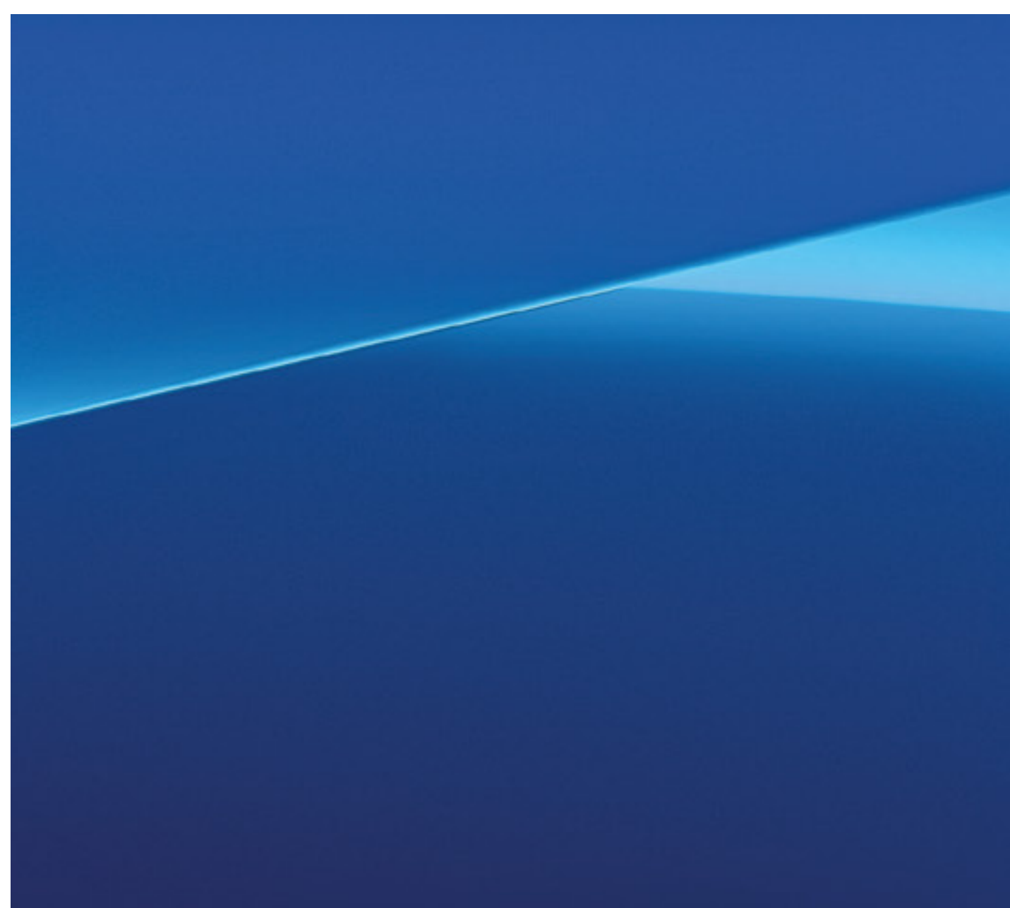
Bleu Alpine (option)